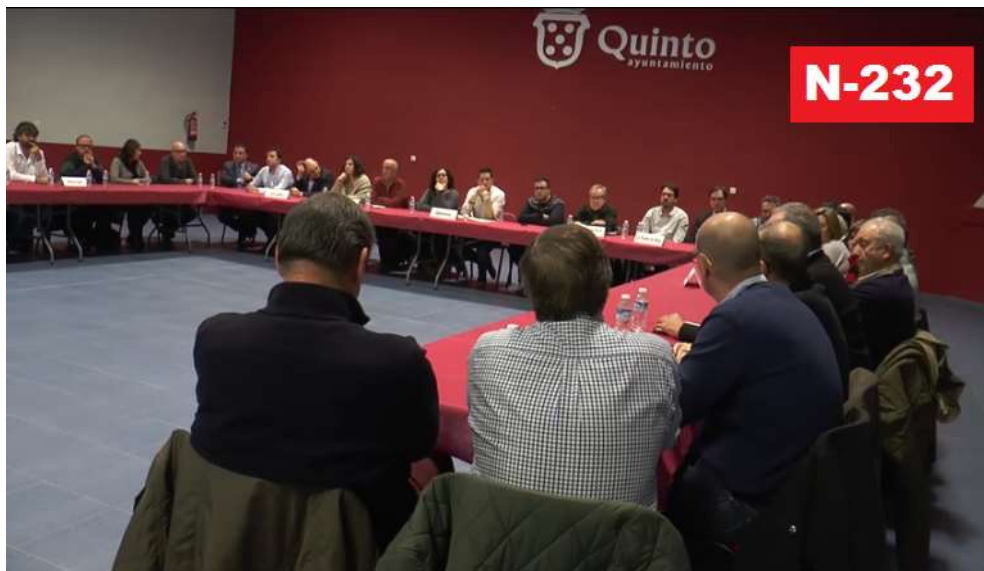
Reunión transversal el pasado día 16 de diciembre en Quinto de Ebro.